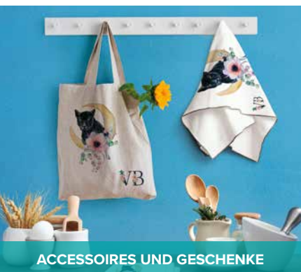
ACCESSOIRES UND GESCHENKE